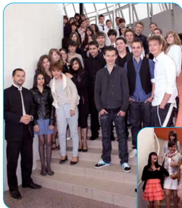
Une descente des marches pleine d'élégance