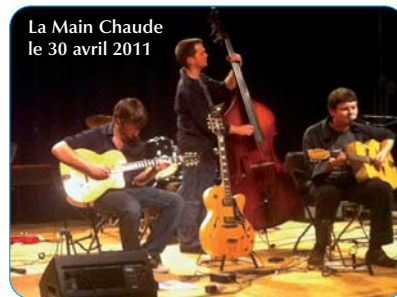
La Main Chaude le 30 avril 2011