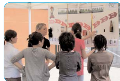
Enfants s'exerçant au tri des déchets avec une animatrice du Sigidurs

l'environnement et du cadre de vie, mais aussi au tri des déchets. Après avoir nettoyé tous les recoins du Terrain d'Aventures et de la place Vauban, du Collège à l'Espace Eiffel, les enfants étaient attendus par des animatrices du Sigidurs qui ont expliqué, de façon ludique, le parcours des déchets, du ramassage au tri, puis leur traitement et recyclage.