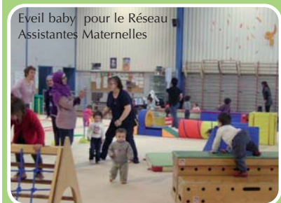
Eveil baby pour le Réseau Assistantes Maternelles

A la fin des séances, après avoir rangé le matériel, tout le monde se retrouve pour chanter et mimer des petites comptines en musique.