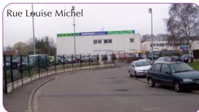
Rue Louise Michel

Celui-ci doit assurer une meilleure sécurité, tant pour les piétons que pour les véhicules et permettra la création de places supplémentaires.