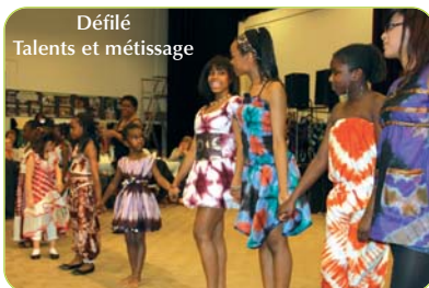
Défilé Talents et métissage