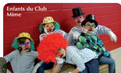
Enfants du Club Mime

A plus long terme : • Ouverture d'une classe bilingue (niveau 6ème). • Plusieurs salles de cours seront rénovées et un tableau numérique interactif sera installé grâce à l'aide du Conseil général.