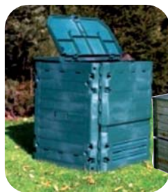
Éco-composteur, en plastique et en bois.

en effet, de diminuer fortement les tonnages de déchets à collecter et de limiter les coûts liés à leur traitement.