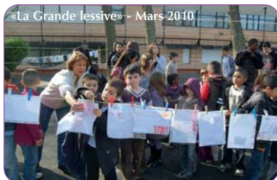
«La Grande lessive» - Mars 2010