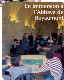
En immersion à l'Abbaye de Royaumont