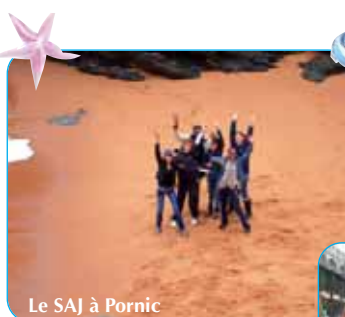
Le SAJ à Pornic

Au Service Animation Jeunesse, la cinquantaine de jeunes a fait le plein d'énergie et de découvertes grâce aux diverses activités d'été, dont un séjour à Pornic, au camping de la Madrague. Le bord de mer, les activités de plage et les sorties en ville, au marché, à la piscine, au cinéma... ont ravi les adolescents.