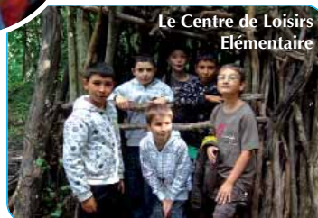
Le Centre de Loisirs Élémentaire