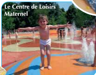
Le Centre de Loisirs Maternel