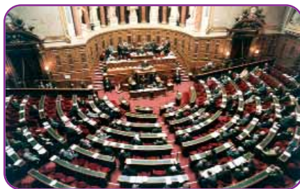
Sénat - L'hémicycle

Ils sont cinq dans notre département : Bernard Angels (PS) - Robert Hue (PC) - Raymonde Le Texier (PS) - Lucienne Malovry (UMP) et Hugues Portelli (UMP).