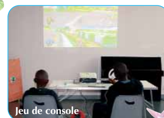
Jeu de console