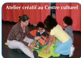
Atelier créatif au Centre culturel