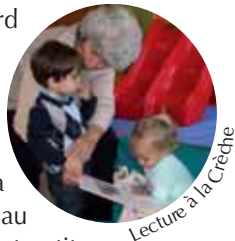
Lecture à la Crèche

Défilé intergénérationnel avec les enfants des Accueils de loisirs