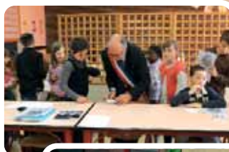
Signature des cartes de Conseillers par le Maire