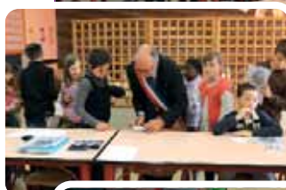
Signature des cartes de Conseillers par le Maire