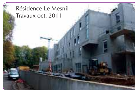
Résidence Le Mesnil - Travaux oct. 2011