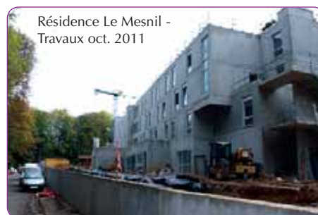
Résidence Le Mesnil - Travaux oct. 2011