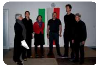
Ensemble vocal Nonna Sima

L'escapade en Italie, n'a duré qu'une soirée mais a cependant été très appréciée par nombre de Bouffémontois. Ils se souviendront de ces magnifiques polyphonies italiennes chantées par l'ensemble vocal de l'Atelier Nonna Sima, ainsi que des succulentes spécialités gastronomiques.