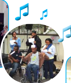
La Fête de la Musique