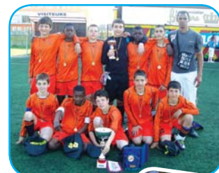
Les tournois et fêtes des clubs sportifs