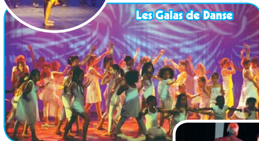
Les Galas de Danse