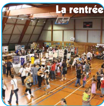
La rentrée se prépare !

Les services municipaux, les associations et les clubs sportifs vous souhaitent de bonnes vacances !