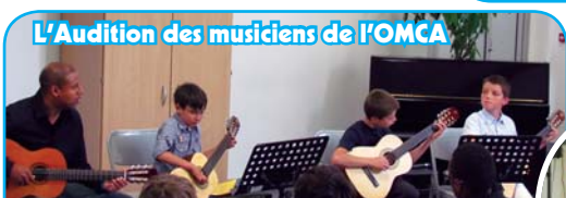
L'Audition des musiciens de l'OMCA