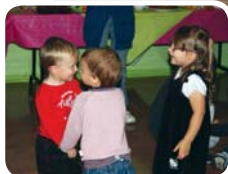
La Fête de la Grèche