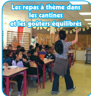
Les repas à thème dans les cantines et les goûters équilibrés