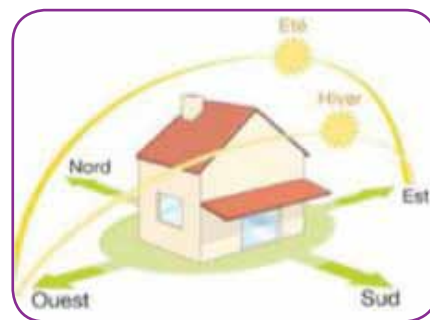
Optimisation des façades ensoleillées

L'un des enjeux majeurs du nouvel éco-quartier est de préserver et de valoriser ces lieux de convivialité et de rencontre, qui font l'identité de la ville.