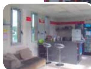
Le club house : un équipement très attendu par le Tennis Club.