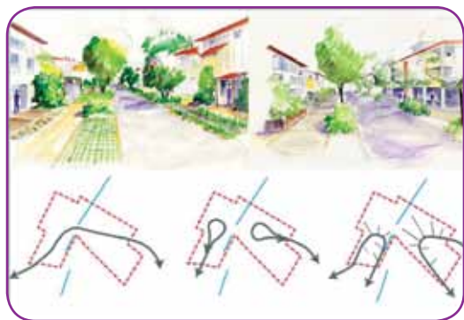
Circulation dans l'éco-quartier : 3 configurations possibles

D'autre part, l'objectif d'un éco-quartier, c'est aussi la mixité fonctionnelle : les jardins partagés, le développement d'une agriculture de proximité, les lieux de promenade, les jeux pour enfants favorisent la cohabitation et les échanges au sein de la population.