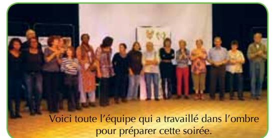
Voici toute l'équipe qui a travaillé dans l'ombre pour préparer cette soirée.

Si vous n'avez pas pu participer à cette soirée, vous pouvez manifester votre solidarité en envoyant un don à Frères des Hommes - 16 rue des Dentellières 95570 Bouffémont.