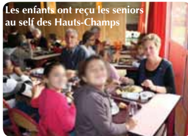
Les enfants ont reçu les seniors au self des Hauts-Champs

Bravo aux services municipaux, à l'Arbre et à la direction des Myosotis !