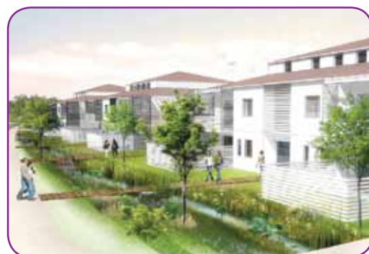
Exemple d'éco-quartier dans la région Sud Ouest

Ce projet est complexe et suscite beaucoup d'interrogations. Nous y répondrons ensemble au cours des prochaines semaines et des prochains mois lors des réunions publiques et des ateliers citoyens.