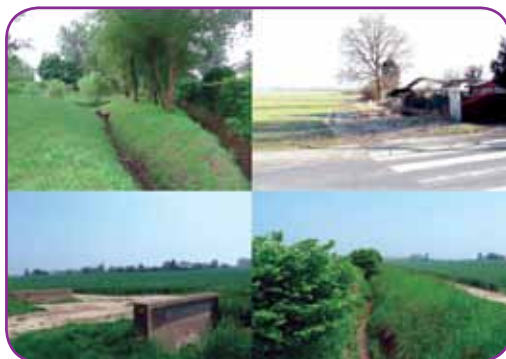
Le ru, ses berges et la biodiversité seront mis en valeur

En outre, un éco-quartier est également un quartier où l'on favorise les déplacements à pied et à bicyclette.