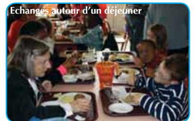
Echanges autour d'un déjeuner