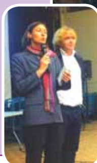
Une centaine de personnes a assisté à la réunion de concertation du 24 octobre 2012, présentée par le Cabinet Bécard & Palay