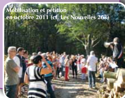
Mobilisation et pétition en octobre 2011 (cf. Les Nouvelles 263)

Habitants et élus s'étaient rassemblés à plusieurs reprises pour manifester leur mécontentement et interpeller l'ONF.