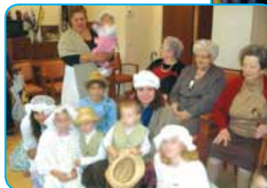
Le beau défilé à la mode d'antan a rassemblé toutes les générations