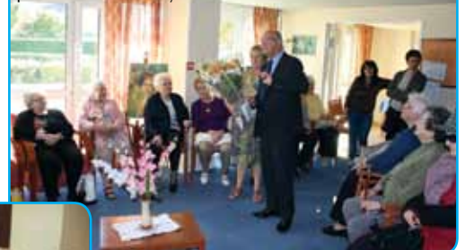
Ouverture de la Semaine Bleue par le Maire aux Myosotis