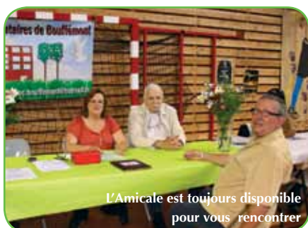
L'Amicale est toujours disponible pour vous rencontrer