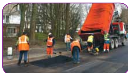
Travaux sur les voies et réseaux : 595 250 €

Grâce aux efforts consentis sur les dépenses de fonctionnement, on peut consacrer environ 230€/habitant aux dépenses d'investissement (145€ avant 2008).