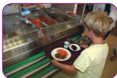
Enseignement (dont création d'un self au Trait d'Union) : 101 885 €