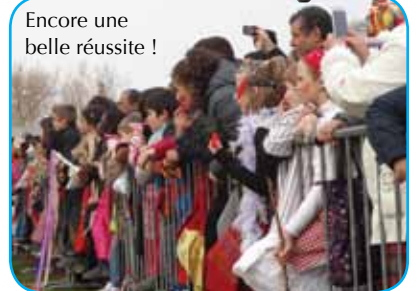
Encore une belle réussite !