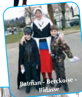
Batman - Berckoise - Bidasse