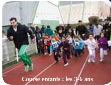
Course enfants : les 3-6 ans