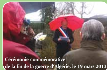
Cérémonie commémorative de la fin de la guerre d'Algérie, le 19 mars 2013

Le 19 mars 1962, le Chef de l'État, le Général de Gaulle et son Gouvernement, ont engagé la France en toute légitimité républicaine. Il aura fallu attendre ce 19 mars 2013 pour que les cérémonies de commémoration soient désormais organisées sous l'égide du Gouvernement.