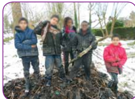
Chantier éducatif : les cinq participants n'ont pas été découragés par les intempéries

Cinq jeunes de 11 et 12 ans ont participé à un chantier éducatif au cours de la deuxième semaine des vacances de février. Ils ont mené à bien deux projets : le fleurissement des abords