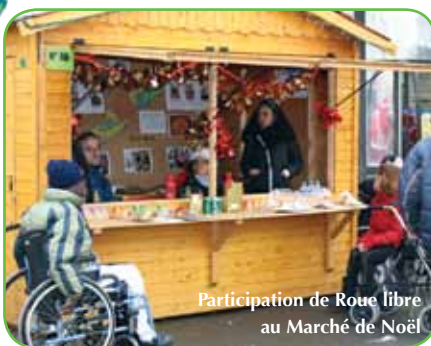
Participation de Roue libre au Marché de Noël

Roue libre est présente lors des manifestations organisées par la municipalité : Forum des associations, marchés de Noël, etc.