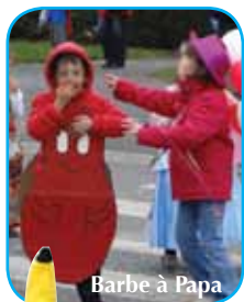
Barbe à Papa