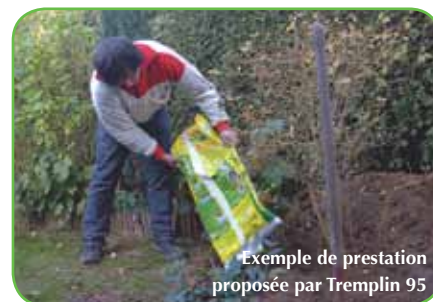
Exemple de prestation proposée par Tremplin 95

L'agrément dont dispose l'association permet à ses clients de bénéficier d'un crédit d'impôt* . Au-delà du prix, faire appel à Tremplin 95, c'est aussi participer au développement économique et à l'emploi local.