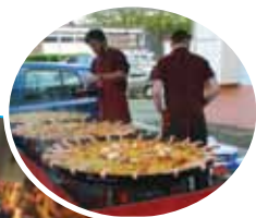
Le CME, l'OBS, les services municipaux et l'OMCA vous ont proposé un large choix d'animations