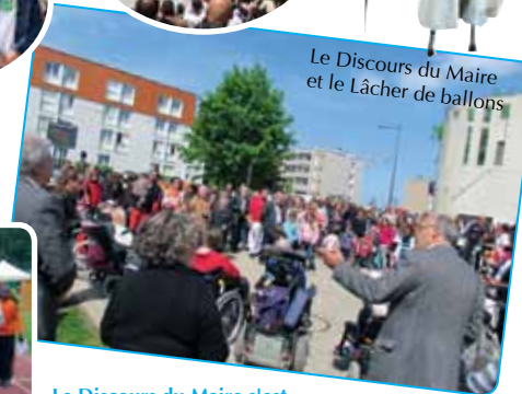
Le Discours du Maire et le Lâcher de ballons