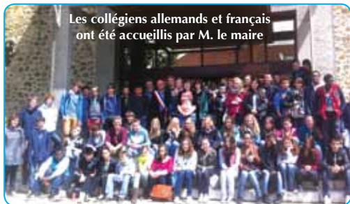
Les collégiens allemands et français ont été accueillis par M. le maire