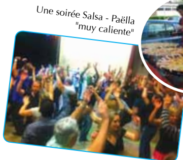
Une soirée Salsa - Paëlla "muy caliente"