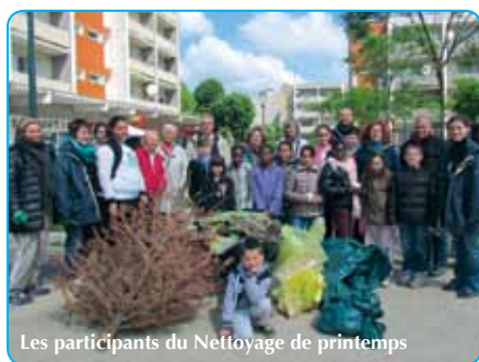
Les participants du Nettoyage de printemps

Parents, enfants, représentants du Conseil Municipal Enfants s'étaient donnés rendez-vous pour le ramassage des déchets en ville.