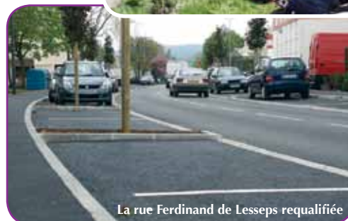
La rue Ferdinand de Lesseps requalifiée

coût global de 191 689 €, financé par le Conseil général (51 385 €) et la CCOPF à hauteur de 140 304 €.