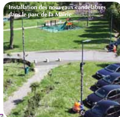
Installation des nouveaux candélabres dans le parc de la Mairie

Après deux mois et demi de travaux, la rue F. de Lesseps est enfin terminée. Voirie et espaces verts ont fait l'objet d'un soin particulier, pour un