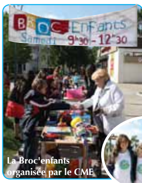
La Broc'enfants organisée par le CME