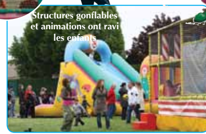
Structures gonflables et animations ont ravi les enfants