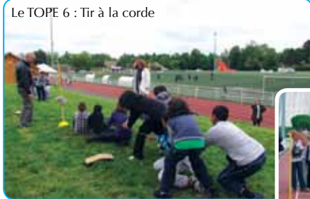
Le TOPE 6 : Tir à la corde