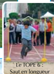
Le TOPE 6 : Saut en longueur