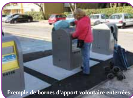
Exemple de bornes d'apport volontaire enterrées

Les bornes enterrées présentent plusieurs avantages. Outre l'aspect esthétique, elles ont une grande capacité de contenance, sont plus silencieuses et utilisent moins d'espace au sol. Enfin, elles sont plus propres et plus sécurisées car elles n'obstruent pas la visibilité lorsqu'elles sont implantées près des axes routiers.