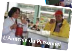
L'Amicale du Personnel