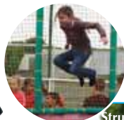
Atelier Cirque du service Enfance