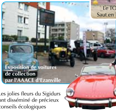
Exposition de voitures de collection par l'AAACE d'Ezanville