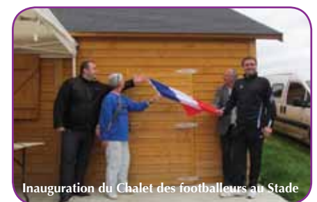
Inauguration du Chalet des footballeurs au Stade