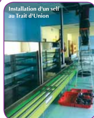
Installation d'un self au Trait d'Union