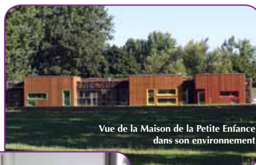
Vue de la Maison de la Petite Enfance dans son environnement

Le RAM (Relais d'Assistantes Maternelles), intégré dans la structure, accueillera une fois par semaine des en-