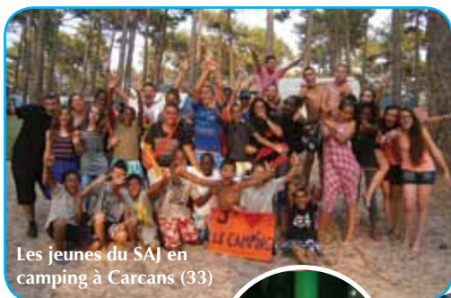
Les jeunes du SAJ en camping à Carcans (33)