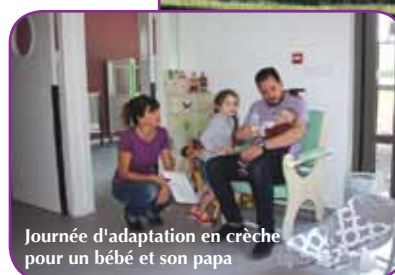
Journée d'adaptation en crèche pour un bébé et son papa

fants accompagnés de leur assistante maternelle, sous la houlette d'une éducatrice de jeunes enfants.