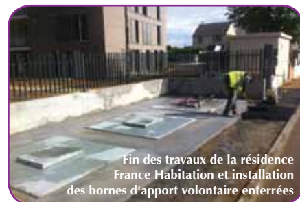
Fin des travaux de la résidence France Habitation et installation des bornes d'apport volontaire enterrées