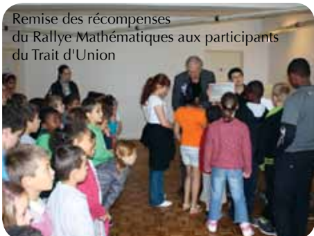
Remise des récompenses du Rallye Mathématiques aux participants du Trait d'Union