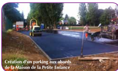
Création d'un parking aux abords de la Maison de la Petite Enfance