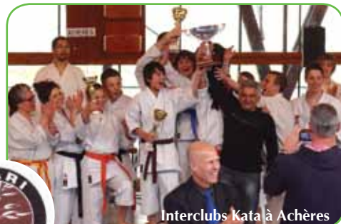
Interclubs Kata à Achères