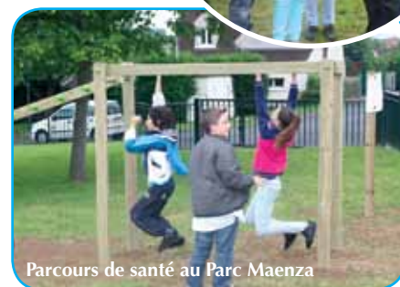
Parcours de santé au Parc Maenza