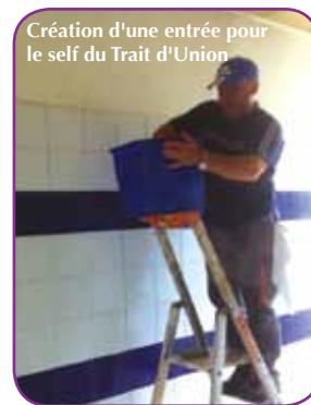
Création d'une entrée pour le self du Trait d'Union