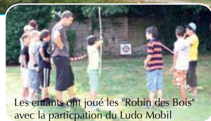
Les enfants ont joué les "Robin des Bois" avec la participation du Ludo Mobil