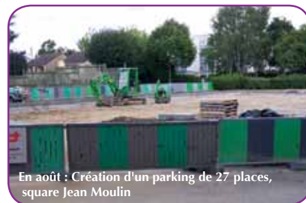
En août : Création d'un parking de 27 places, square Jean Moulin

Les services techniques municipaux ont profité de la période estivale pour réaliser des travaux de rénovation dans les structures municipales et les écoles. Ils ont, entre autres, rénové un espace pour l'ouverture de la nouvelle classe à l'école des Hauts-Champs et créé un espace avec lavabos pour l'entrée du self du Trait d'Union.