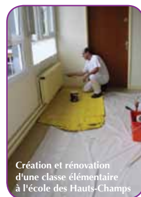
Création et rénovation d'une classe élémentaire à l'école des Hauts-Champs