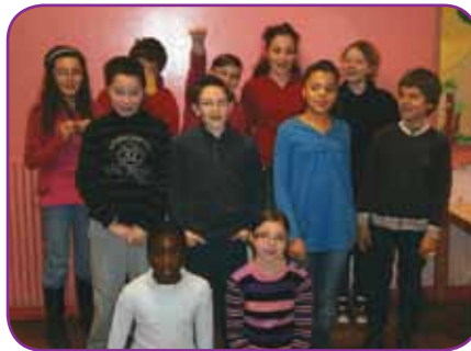
Les enfants du CME 2011/2013

Les enfants sont ravis de ces nouveaux jeux : poutre mobile, barres fixes, mur d'escalade et échelle à se suspendre. Ils rappelleront à ceux qui ont passé leur jeunesse à Bouffémont dans les années 70/80, l'esprit des jeux de quartiers en bois sur lesquels ils ont usé leurs fonds de culottes !