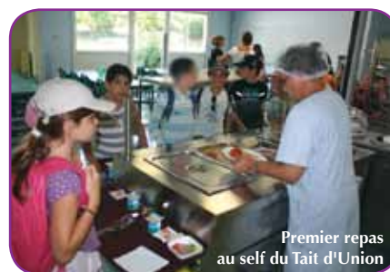
Premier repas au self du Trait d'Union

Les atouts sont multiples : du choix dans les entrées, un service plus fluide, une responsabilisation des enfants, de meilleures conditions d'accueil et sans surcoût pour les familles.