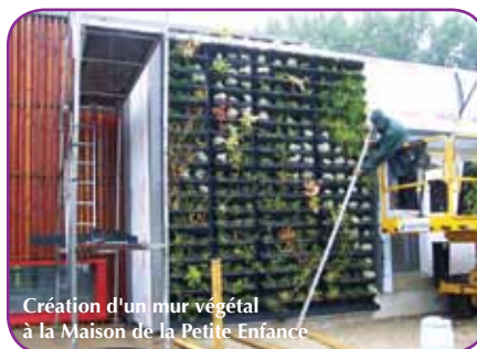
Création d'un mur végétal à la Maison de la Petite Enfance