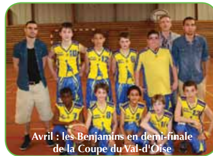
Avril : les Benjamins en demi-finale de la Coupe du Val-d'Oise

Cadets : 2 èmes de la première division du département.