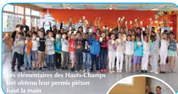
Les élémentaires des Hauts-Champs ont obtenu leur permis piéton haut la main

Le 1 er juillet, des gendarmes ont délivré les Permis Piétons aux CM1/CM2 de l'école des Hauts-Champs. Avec une moyenne générale de 10/12, nos écoliers se sont classés parmi les meilleurs. Bravo !