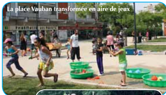
La place Vauban transformée en aire de jeux