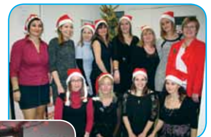
Fête de Noël et remise des cadeaux aux enfants de la Crèche