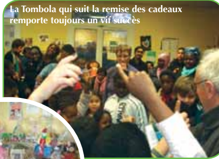
La Tombola qui suit la remise des cadeaux remporte toujours un vif succès

Vacances Enfants et à l'Aide Vacances Familiales sont priées de prendre contact dès à présent, par téléphone.