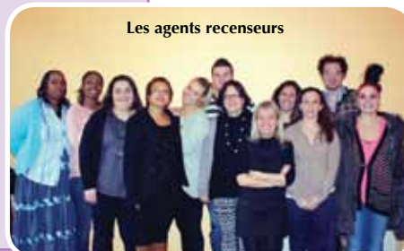
Les agents recenseurs