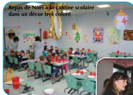
Repas de Noël à la cantine scolaire dans un décor très coloré