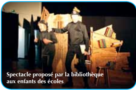
Spectacle proposé par la bibliothèque aux enfants des écoles