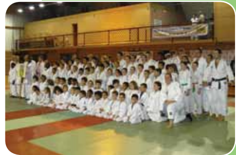
De nombreux adhérents du BAC Judo ont participé au gala

De la cantine des Hauts-Champs en 1973, au Dojo Maurice Cottreau au début des années 2000, que de chemin parcouru pour le Club de Judo de Bouffémont !