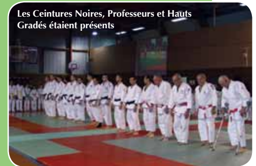
Les Ceintures Noires, Professeurs et Hauts Gradés étaient présents

Si vous souhaitez nous rejoindre dans l'aventure des 10 prochaines années, le BAC Judo vous donne rendez-vous sur le site Internet : www.bacjudo.fr ou flashez le QR Code ci-contre.