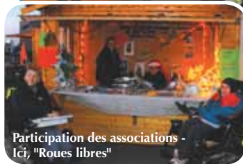
Participation des associations - Ici, "Roues libres"