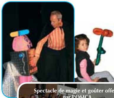
Spectacle de magie et goûter offerts par l'OMCA