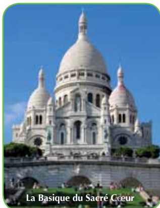
La Basilique du Sacré Cœur

Grande affluence en ce matin d'hiver en gare de Bouffémont. On piétine d'impatience en attendant le train. Arrivés à Paris, nos galocheurs s'engouffrent dans le métro direction Porte Maillot. Au terminus, la troupe s'élance vivement à la conquête de la capitale pour une balade de 10 km dans la ville. Au cours de la promenade, depuis l'Arc de Triomphe, nous avons sillonné maintes rues et quartiers typiques ou atypiques : le parc Monceau, le Parc des Batignolles et bien d'autres sites. Place Clichy, on se dirige vers Montmartre. C'est avec un plaisir sans cesse renouvelé que nous aimons y retourner. Et on se lance bravement à l'assaut de la Butte au fil des rues - escaliers : rue Lepic, le Moulin de La Galette, le Mont Cenis, etc.... Jusqu'à l'imposante Basilique du Sacré-Cœur, nous avons suivi la trace des artistes aux noms évocateurs tels que S.Guitry, Utrillo ou Dalida dans