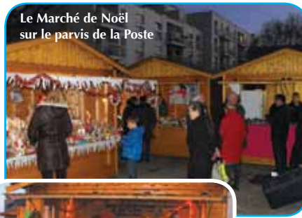
Le Marché de Noël sur le parvis de la Poste