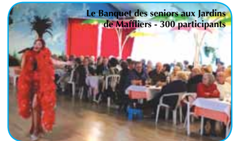
Le Banquet des seniors aux Jardins de Maffliers - 300 participants