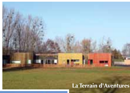
La Terrain d'Aventures

La salle polyvalente du Centre de Loisirs primaire sera complétée de nouveaux matériels de son et lumière et le revêtement de sol sera rénové.