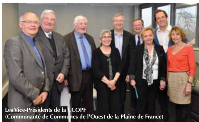
Les Vice-Présidents de la CCOPF (Communauté de Communes de l'Ouest de la Plaine de France)