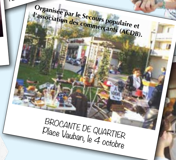
Organisée par le Secours populaire et l'association des commerçants (ACDB).