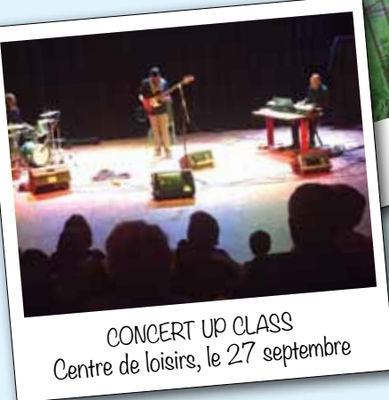
CONCERT UP CLASS Centre de loisirs, le 27 septembre