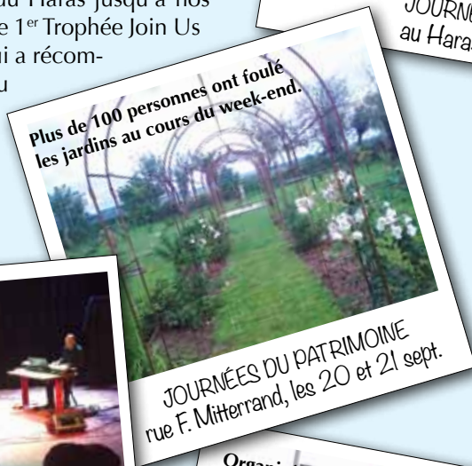
Plus de 100 personnes ont foulé les jardins au cours du week-end.