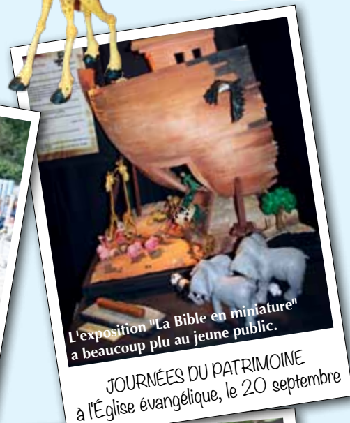
L'exposition "La Bible en miniature" a beaucoup plu au jeune public.