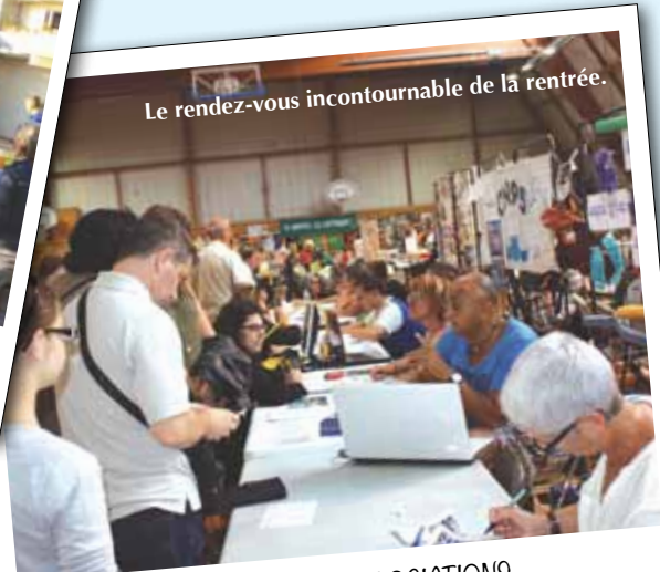
Le rendez-vous incontournable de la rentrée.