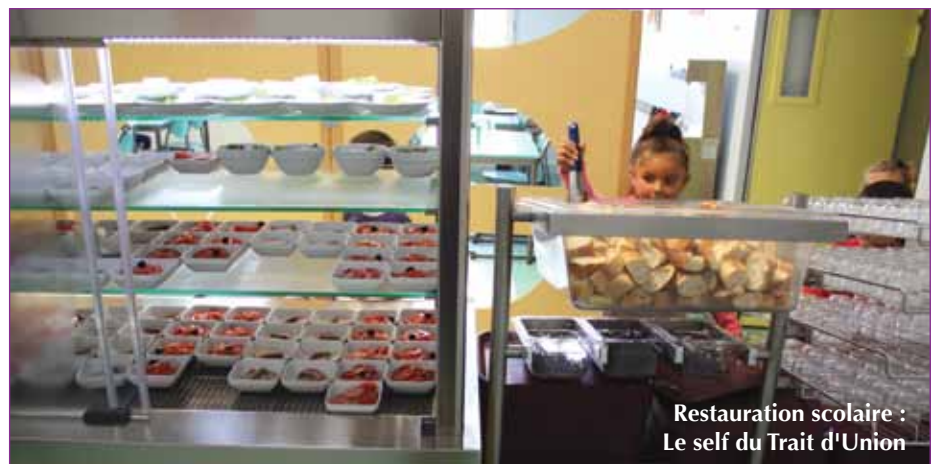
Restauration scolaire : Le self du Trait d'Union