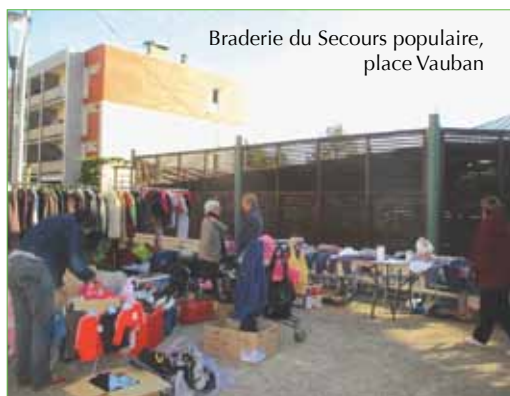
Braderie du Secours populaire, place Vauban

Le samedi suivant, le loto a réuni toutes les générations dans une ambiance à la fois concentrée et joyeuse. Télévision, tablettes, appareil photos, jambon, paniers garnis et autres lots ont fait des heureux.