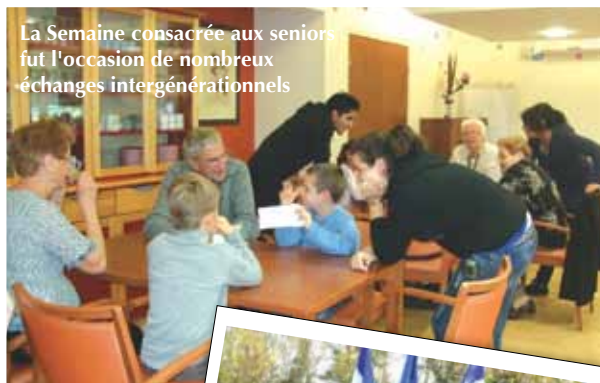
La Semaine consacrée aux seniors fut l'occasion de nombreux échanges intergénérationnels