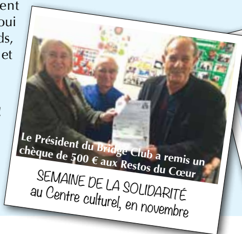
Le Président du Bridge Club a remis un chèque de 500 € aux Restos du Cœur

CENTENAIRE DE LA GRANDE GUERRE au Cimetière, le 11 novembre