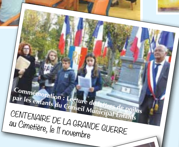
Commémoration : Lecture de lettres de poilus par les enfants du Conseil Municipal Enfants

CENTENAIRE DE LA GRANDE GUERRE au Cimetière, le 11 novembre