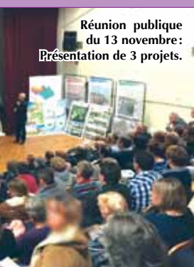
Réunion publique du 13 novembre : Présentation de 3 projets.

Le projet NEXITY en détail sur le site Internet de la ville (Actualités) : www.ville-bouffemont.fr