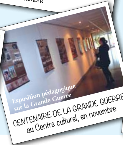
Exposition pédagogique sur la Grande Guerre

SEMAINE DE LA SOLIDARITÉ au Centre culturel, en novembre