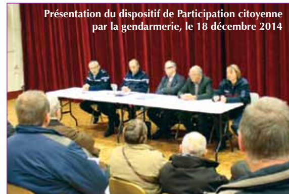
Présentation du dispositif de Participation citoyenne par la gendarmerie, le 18 décembre 2014