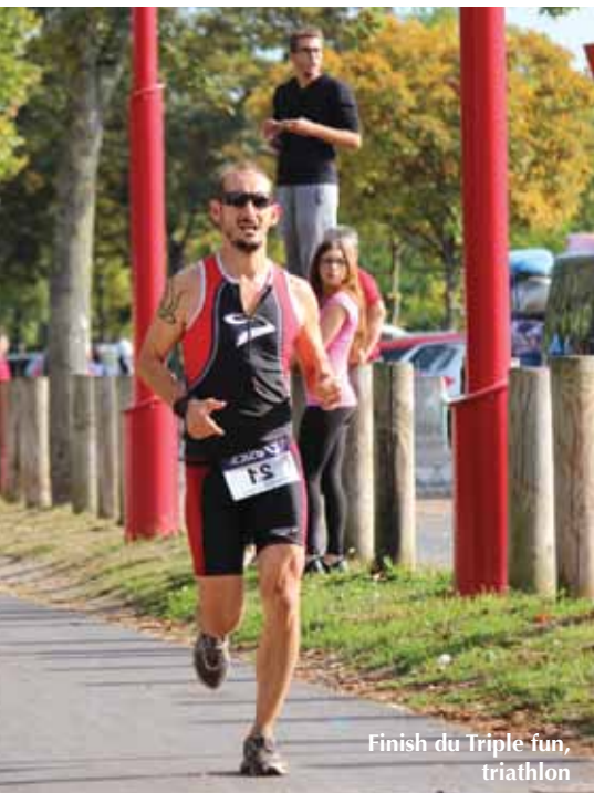
Finish du Triple fun, triathlon

Selon moi, ce qui fait l'intérêt de cette pratique sportive est, en premier lieu, sa facilité d'accès : peu de matériel, on peut pratiquer partout et quand on veut (d'ailleurs, je m'étonne toujours de croiser si peu de Bouffémontois en forêt). Je voulais continuer à pratiquer en toute liberté, mais j'avoue que faire partie d'un club rend l'inscription aux courses beaucoup plus simple ! Cela permet aussi de créer des liens. Depuis quelques mois, j'adhère au club de Domont où j'essaie de porter hautes les couleurs de Bouffémont !