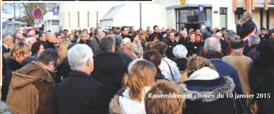
Rassemblement citoyen du 10 janvier 2015