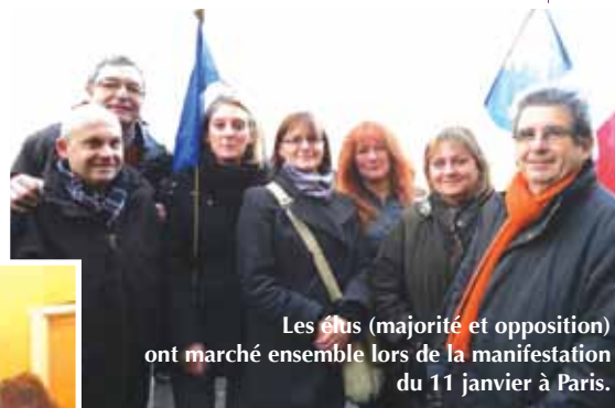
Les élus (majorité et opposition) ont marché ensemble lors de la manifestation du 11 janvier à Paris.