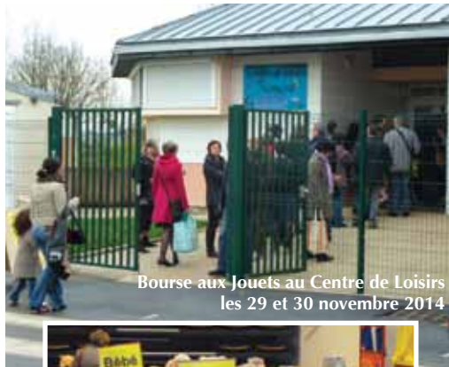
Bourse aux Jouets au Centre de Loisirs les 29 et 30 novembre 2014

Plus de la moitié des articles ont trouvé preneur ce qui est une bonne proportion pour une bourse aux jouets. Grâce à un partenariat avec le Secours Populaire, l'Avenir de Bouffémont organisateur de cette manifestation depuis