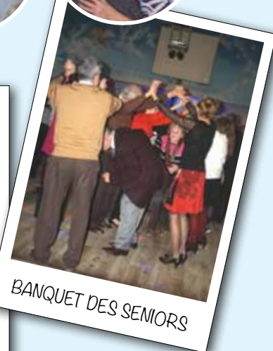
BANQUET DES SENIORS