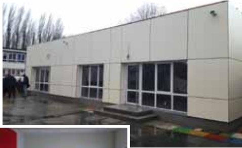
Vue extérieure de l'extension de l'école maternelle

A cette heure, l'extension de l'école maternelle est terminée, les travaux pour le passage couvert et le restaurant scolaire sont en cours d'achèvement. Impactés par la défection d'une entreprise et les contraintes techniques dues aux intempéries, ils se termineront en avril.