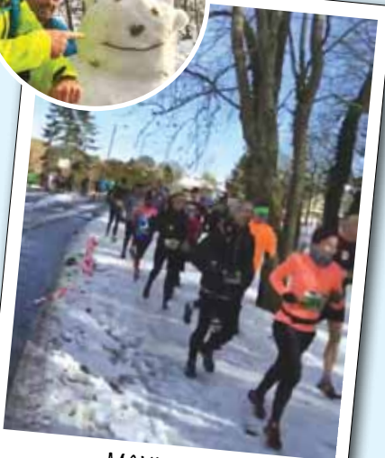
MAXICROSS les 9 et 10 février