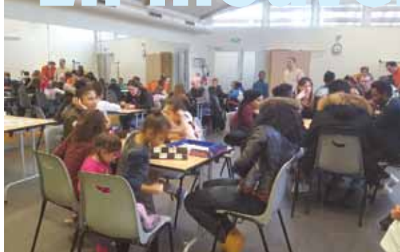
FÊTE DES JEUX Centre culturel, le 17 février