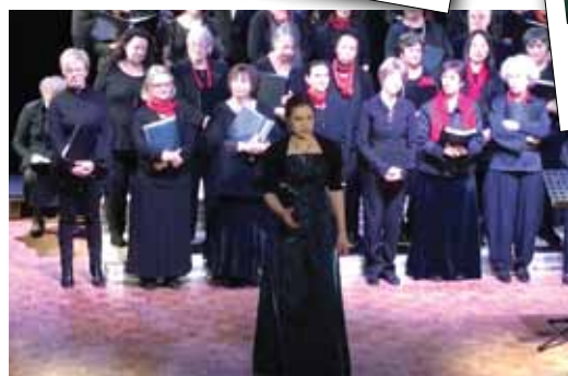
40 e UNE SOIRÉE À L'OPÉRA Centre de Loisirs, le 3 février

Le 22 janvier 2018, le centre social a organisé une journée pour et avec les bénévoles du centre. En effet, nombreuses sont les activités proposées au centre social grâce à la présence active de 35 bénévoles. Sans eux, il n'y aurait pas d'accompagnement à la scolarité, pas d'informaticque, ni d'alphabétisation, de couture ou même d'écrivain public. Alors cette journée avait pour but de mieux les connaître, de définir le bénévolat et de réfléchir avec eux à comment accueillir et intégrer de nouveaux bénévoles, comment rajeunir, fidéliser, étoffer le vivier de bénévoles, comment les valoriser, et enfin quel est l'impact organisationnel du bénévolat ? Plusieurs pistes de travail ont ainsi pu voir le jour : créer un livret d'accueil pour les nouveaux bénévoles, leur proposer d'avoir un référent les premier mois, développer les temps d'échange entre bénévoles, instaurer des temps de convivialité... Cette journée a aussi été l'occasion, en présence du maire et des élus en charge des affaires sociales et du centre social, de leur dire merci au nom des Bouffémontois qui fréquentent l'espace Eiffel et de les remercier de leur engagement sur la commune.