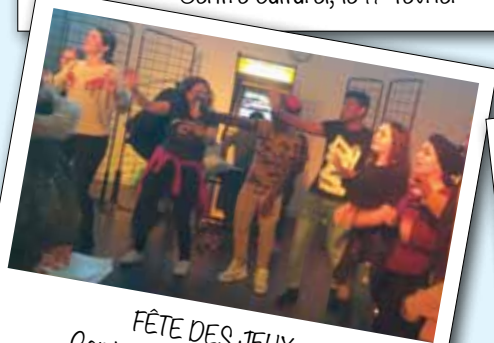
FÊTE DES JEUX Centre culturel, le 17 février