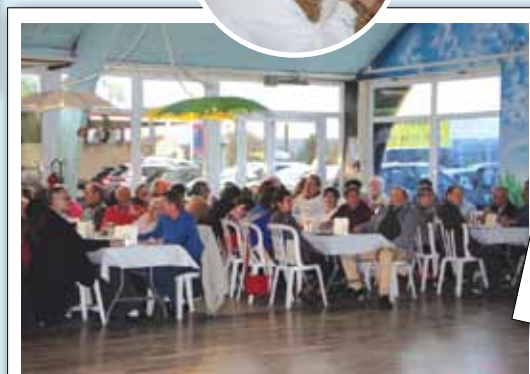
BANQUET DES SENIORS Jardins de Maffliers, le 6 janvier