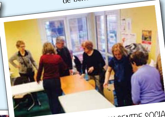
JOURNÉE DES BÉNÉVOLES DU CENTRE SOCIAL Espace Eiffel, le 22 janvier