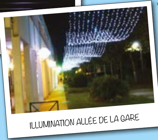
ILLUMINATION ALLÉE DE LA GARE