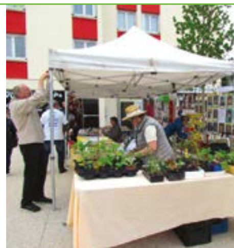
A l'image des Incroyables Comestibles (en photo), les clubs et associations bouffémontois peuvent tenir une permanence sur la place Vauban le samedi pendant le marché.