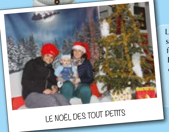
LE NOËL DES TOUT PETITS

Les commerçants ambulants étaient au rendez-vous, malgré une météo défavorable. Merci à eux ainsi qu'aux visiteurs. Pendant que le groupe Kif Orkestra réchauffait les cœurs, le Père Noël faisait sa tournée en calèche, au son de la Batucada.