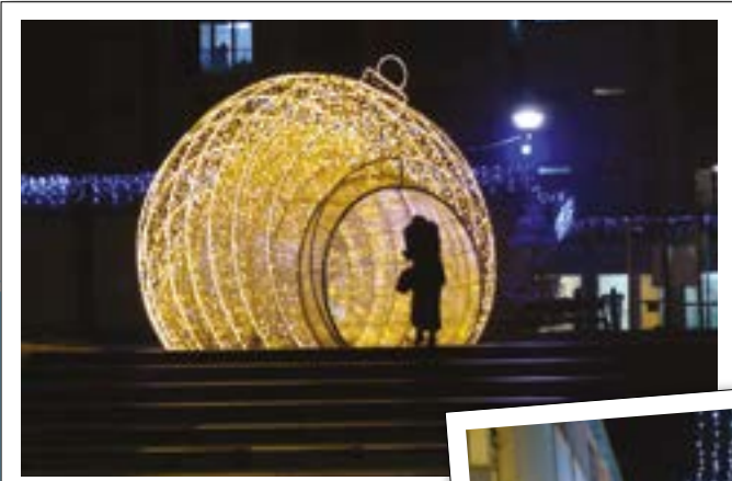
ILLUMINATION PLACE VAUBAN