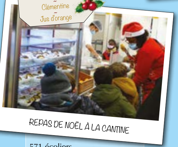
REPAS DE NOËL À LA CANTINE

571 écoliers de maternelle et d'élémentaire étaient inscrits à la cantine pour le repas de Noël.