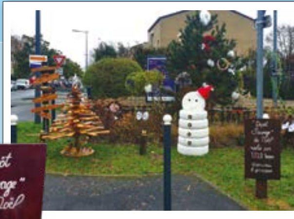
DÉCORATIONS DE NOËL

Les membres de Territoire Zéro Chômeur de Longue Durée ont fabriqué puis installé, des décorations de Noël réalisées à 100% avec des déchets et matériaux de récupération. On valorise !