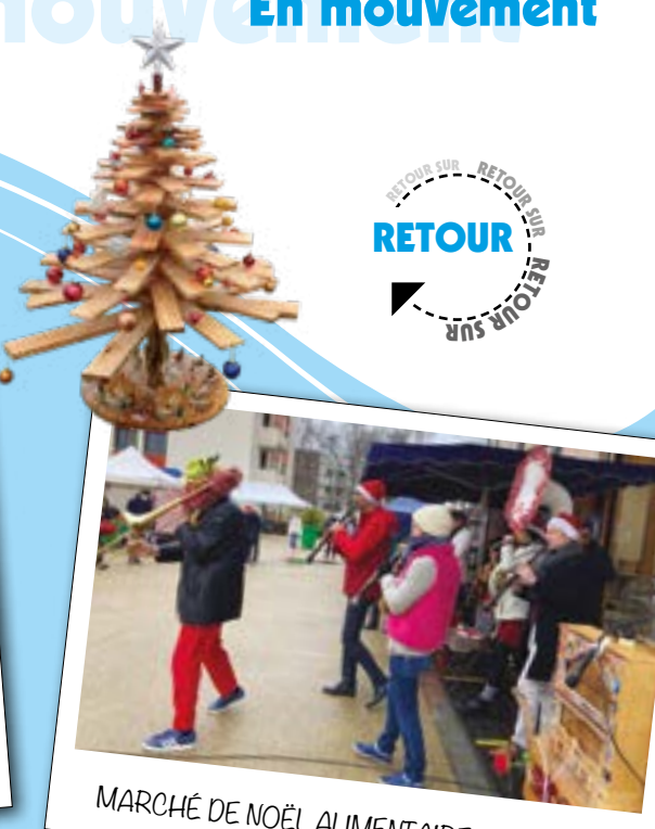
MARCHÉ DE NOËL ALIMENTAIRE ET MUSICAL