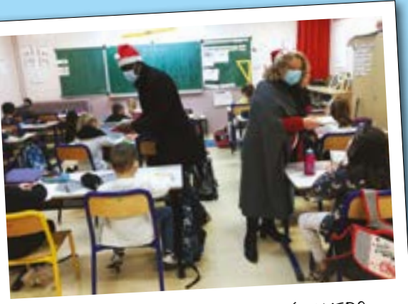
DISTRIBUTION DE CADEAUX AUX ÉCOLIERS

571 écoliers de maternelle et d'élémentaire étaient inscrits à la cantine pour le repas de Noël.